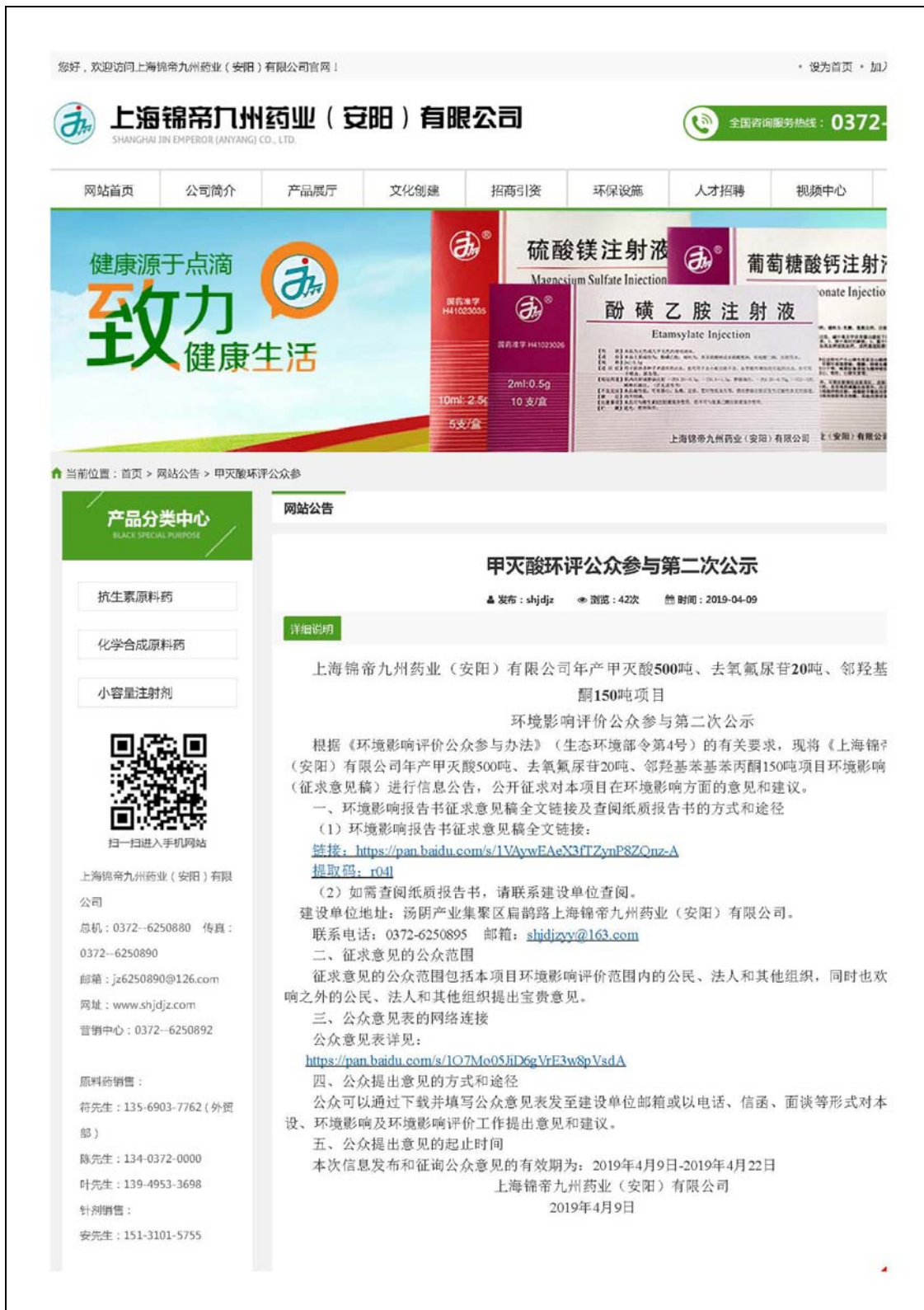
图 3.2-2 本项目第二次公示补充公示网站公告