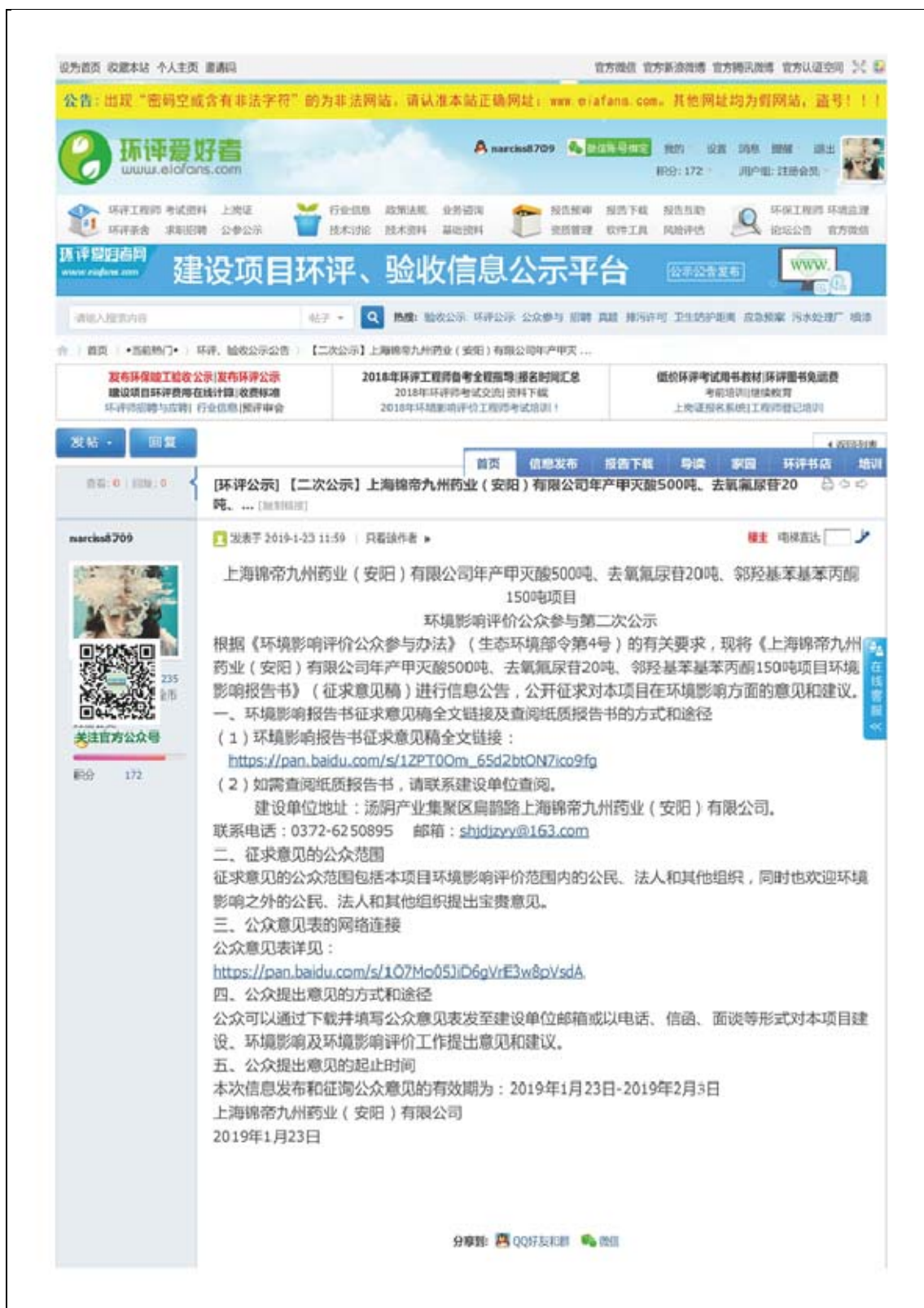
图 3.2-1 本项目第二次公示网站公告