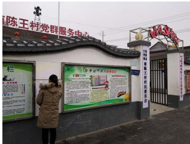
南陈王村张贴公示