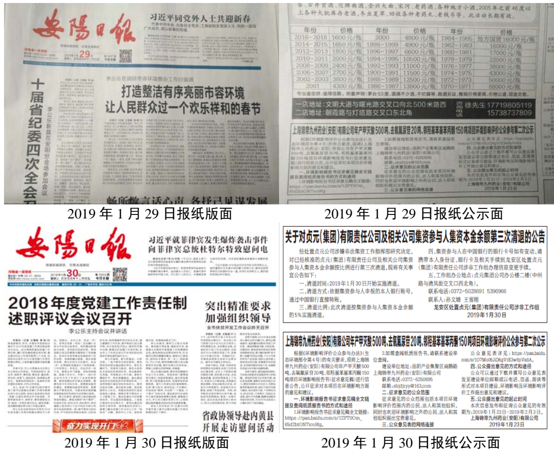
图 3.2-3 本项目第二次公示报纸公开照片

本单位选取安阳日报对本项目进行环境影响评价第二次公示,安阳日报是本项目所在地公众易于接触的报纸,载体的选取符合《环境影响评价公众参与办法》(部令 第4号)对于公示报纸公开的要求。报纸公示时间为2019年1月29日和2019年1月30日(共计2次),满足《环境影响评价公众参与办法》(部令 第4号)对于公示报纸公开在征求意见的10个工作日内公开信息不得少于2次的要求,本项目第二次公示报纸公开照片见图3.2-3。