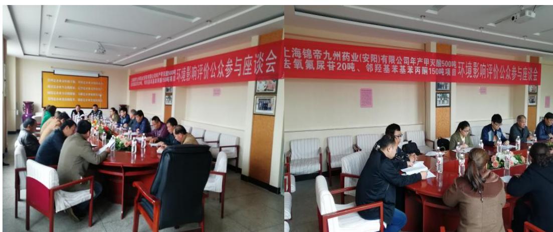
图 4.1-1 本项目公众参与座谈会现场

首先，会议由上海锦帝九州药业（安阳）有限公司领导介绍了本单位主要生产产品情况及本项目的的基本情况，并由评价单位介绍了本项目的主要环境影响及环境影响报告书的相关内容。随后与会代表对该项目的环境影响情况进行了深入讨论、积极发言，最终通过本单位与评价单位的讲解，使公众消除疑虑，本项目公众参与座谈会圆满结束。